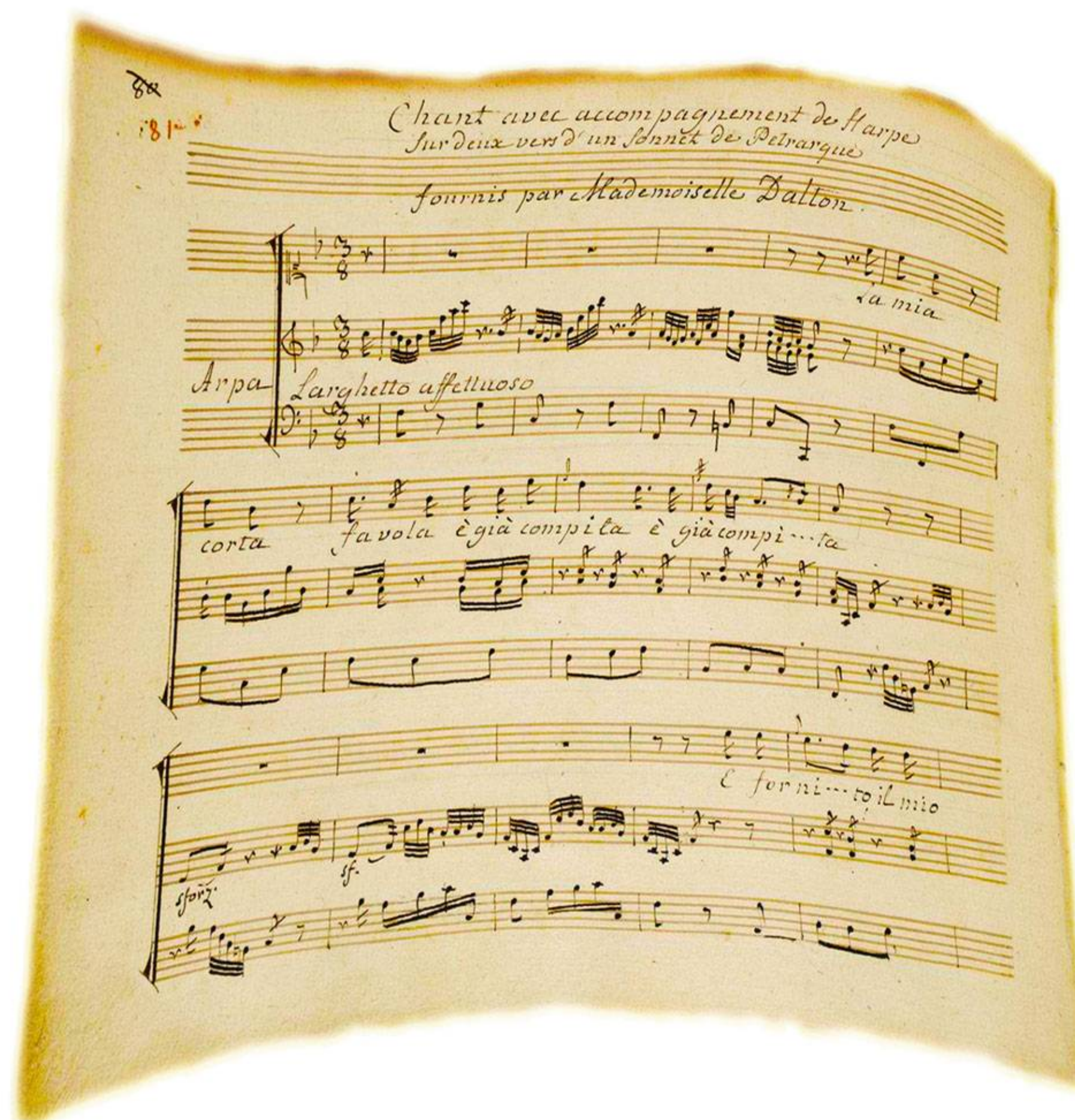
Manuscrit de Jean-Jacques Rousseau